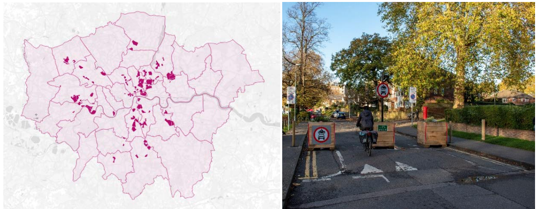
Abb. 2: Low Traffic Neighbourhoods in Londoner Bezirken, umgesetzt zwischen März 2020 und März 2022

Quelle: Aldred & Thomas, 2023 (links); rechts: modaler Filter im LTN Kingston upon Thames; Bild: Jack Fifield via Flickr